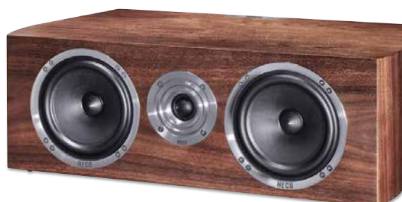
CELAN REVOLUTION CENTER 4