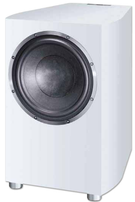
CELAN REVOLUTION SUB 32A