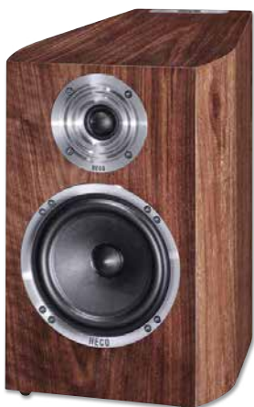
CELAN REVOLUTION 3