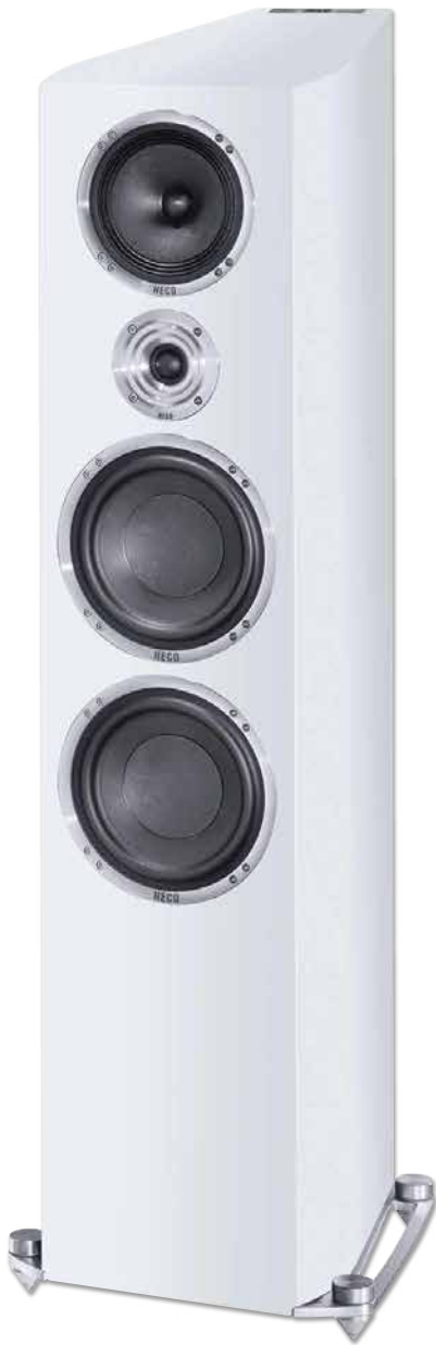
CELAN REVOLUTION 9