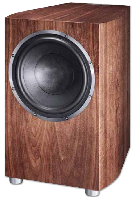
CELAN REVOLUTION SUB 32A