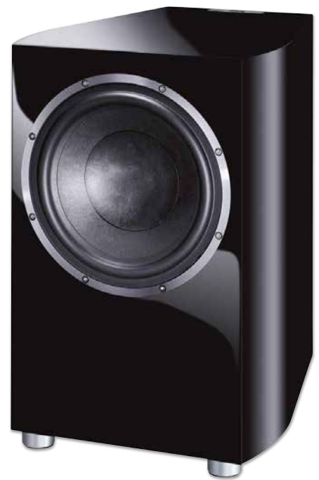
CELAN REVOLUTION SUB 32A