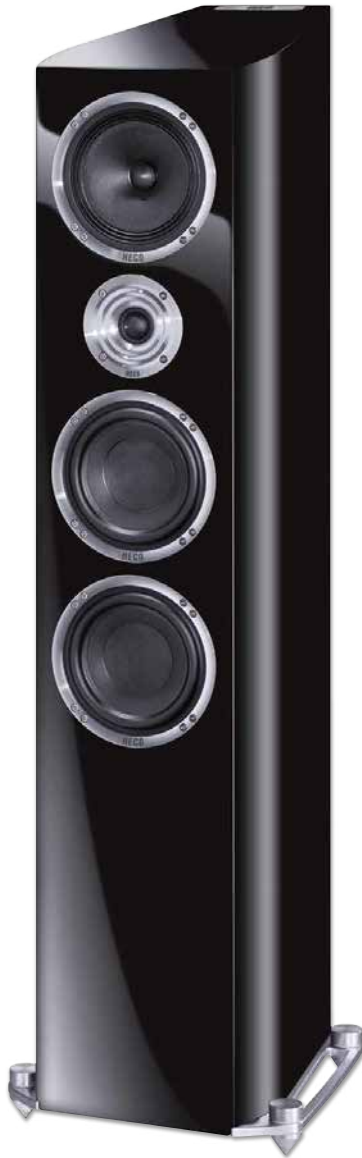
CELAN REVOLUTION 7