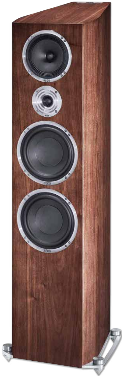
CELAN REVOLUTION 9