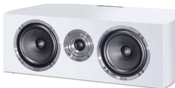
CELAN REVOLUTION CENTER 4