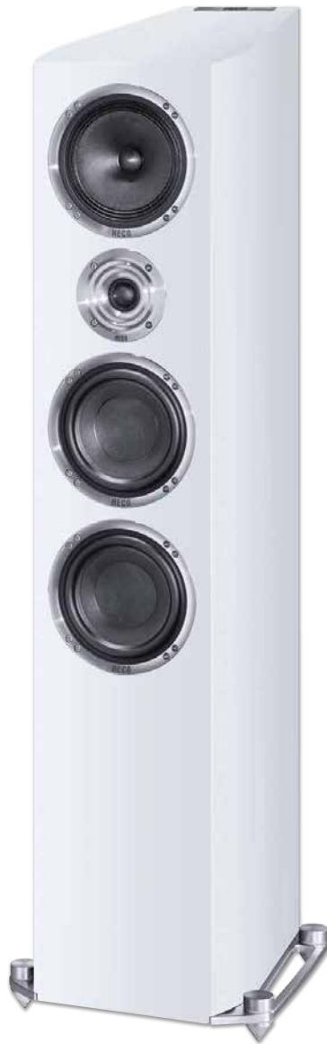
CELAN REVOLUTION 7