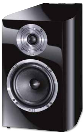
CELAN REVOLUTION 3