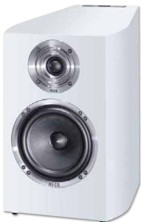
CELAN REVOLUTION 3