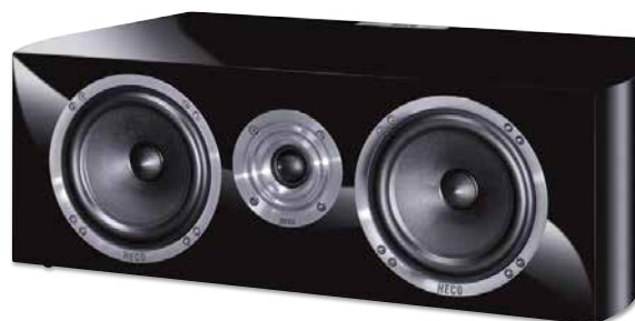
CELAN REVOLUTION CENTER 4