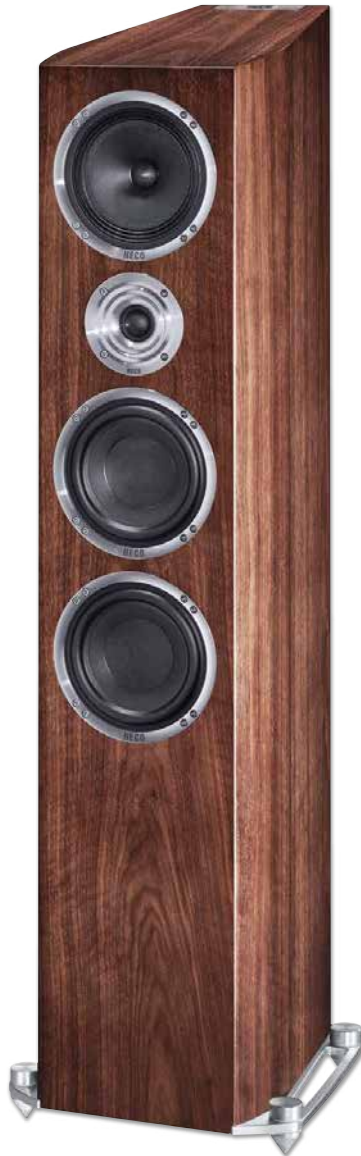
CELAN REVOLUTION 7