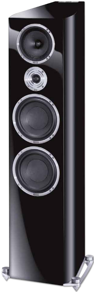
CELAN REVOLUTION 9