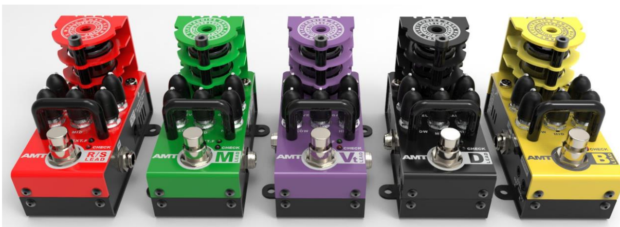
Рис.1 Ламповые преампы X-Lead

Данное руководство является предварительным и относится к первым пяти ламповым преампам X-Lead.